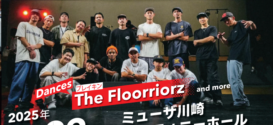
Dances ブレイキン The Floorriorz and more

2025年 3月22日(土) ミューザ川崎 シンフォニーホール 17:00開演 (16:30開場)