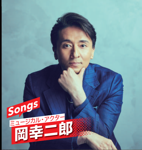
Songs ミュージカル・アクター 岡幸二郎