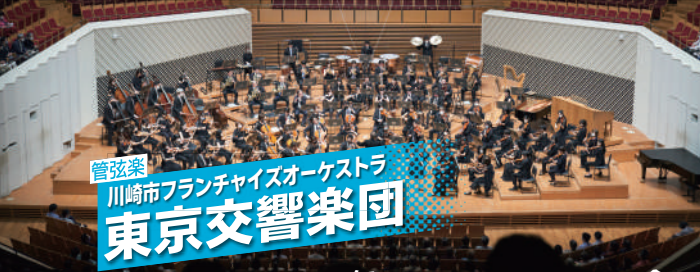
管弦楽 川崎市フランチイズオーケストラ 東京交響楽団