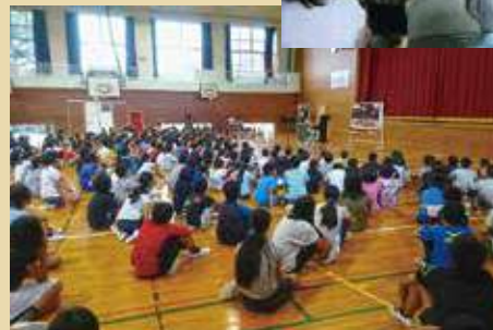
文化庁「文化芸術による子供の育成事業」ワークショップ 長崎県長与町立長与北小学校 2016年9月28日