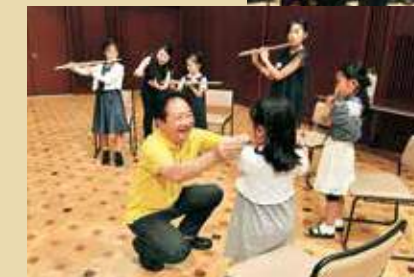
「こども定期演奏会」楽器体験 2016年7月9日