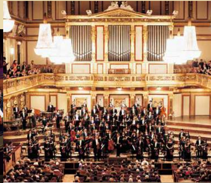
オーストリア・ウィーン公演 2016年10月24日