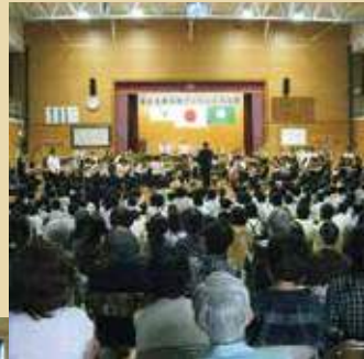
文化庁「文化芸術による子供の育成事業」 熊本県宇城市立小川小学校 2016年6月13日