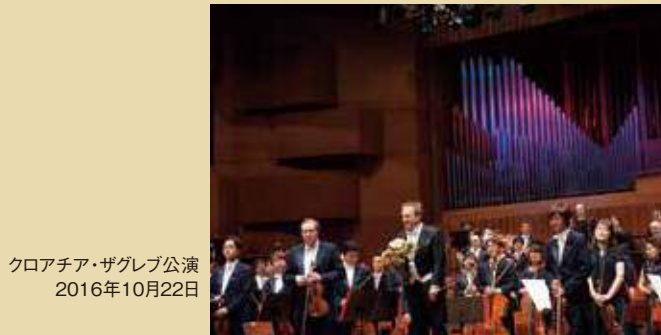
クロアチア・ザグレブ公演 2016年10月22日