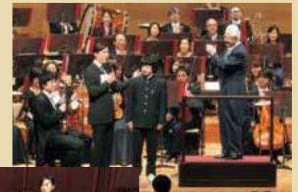
「こども定期演奏会」 2016年4月9日