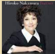
CD「中村紘子フォーエバー」