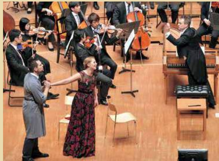
ミュゼザ川崎シンフォニーホール 「ロジ・ファン・トゥッテ」 指揮=ジョナサン・ノット 2016年12月9日