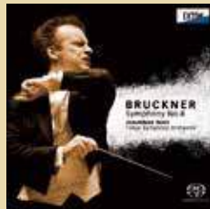
CD「ブルックナー：交響曲第8番」