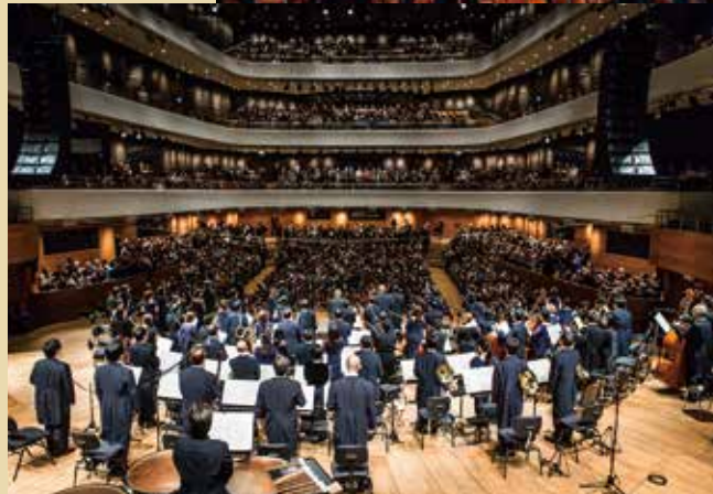
ポーランド・ポズナフ公演 2016年10月20日