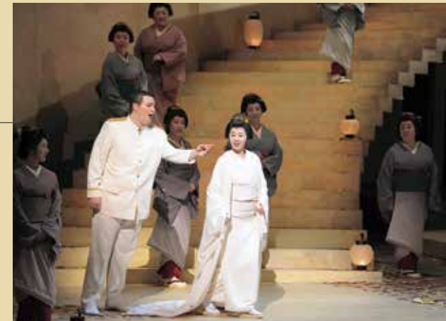
新国立劇場「蝶々夫人」 2017年2月