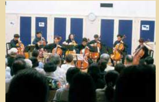
Concert For Smiles チャリティーコンサート