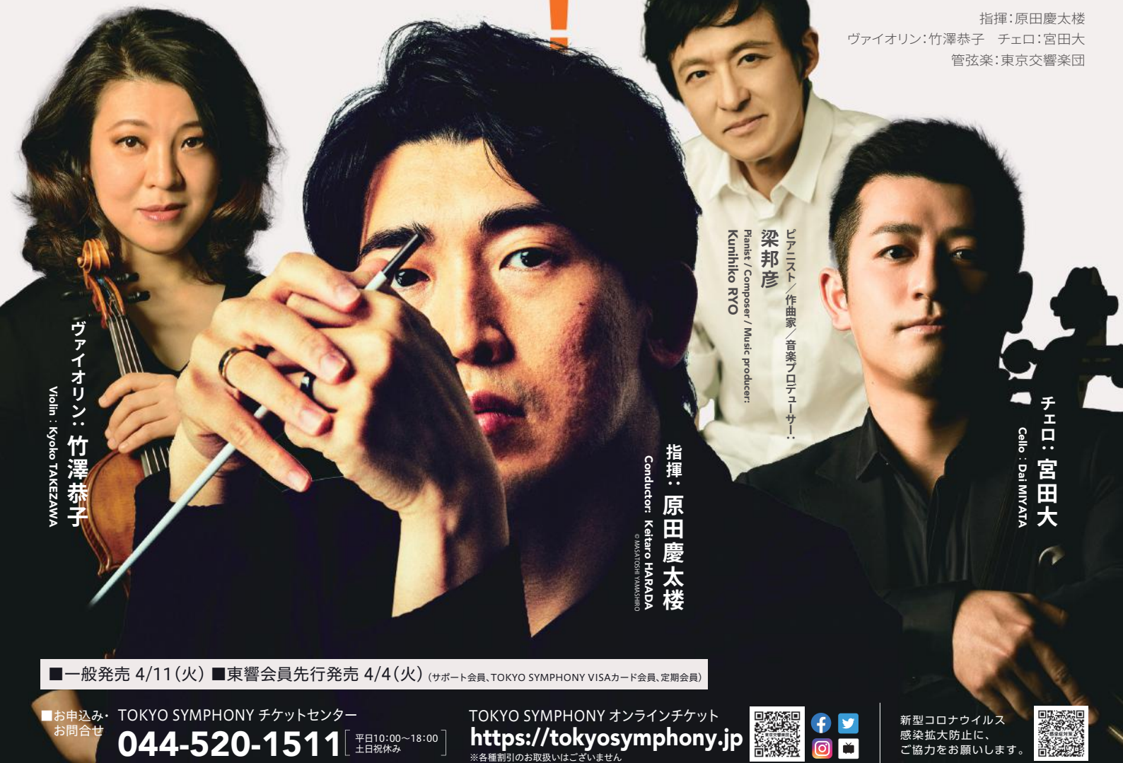
ヴァイオリン: 竹澤恭子 Violin: Kyoko TAKEZAWA