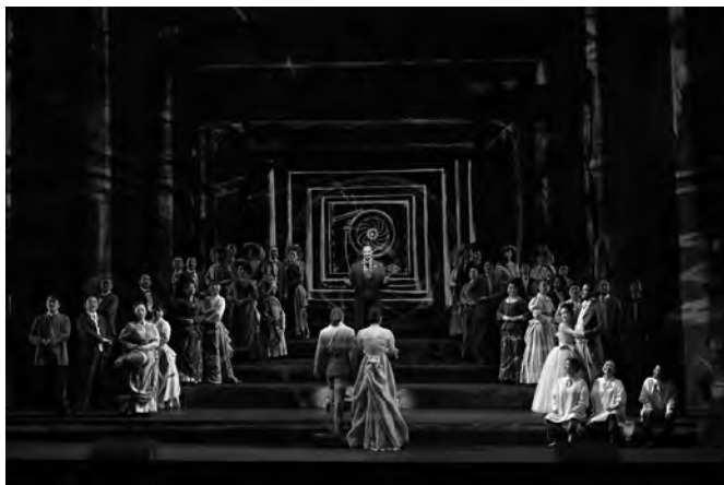
【魔笛】2018年10月公演より

新国立劇場は、オペラ、バレエ、ダンス、演劇という現代舞台芸術のためのわが国唯一の国立劇場として、1997年10月に開場した。新国立劇場合唱団も年間を通じて行われる数多くのオペラ公演の核を担う合唱団として活動を開始。メンバーは100名を超え、新国立劇場で上演されるシーズン公演の出演に加え、2007年からは劇場外からの出演依頼の声に応じて外部公演への出演を開始した。個々のメンバーは高水準の歌唱力と演技力を有しており、合唱団としての優れたアンサンブル能力と豊かな声量は、公演ごとに共演する出演者、指揮者、演出家・スタッフはもとより、国内外のメディアからも高い評価を得ている。