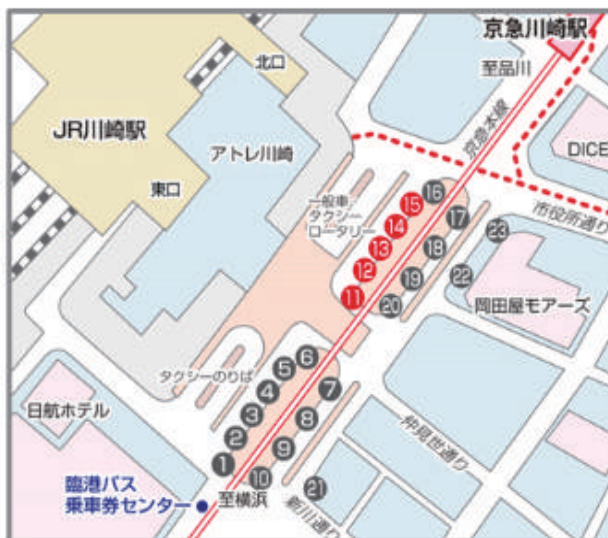
川崎駅東口拡大図