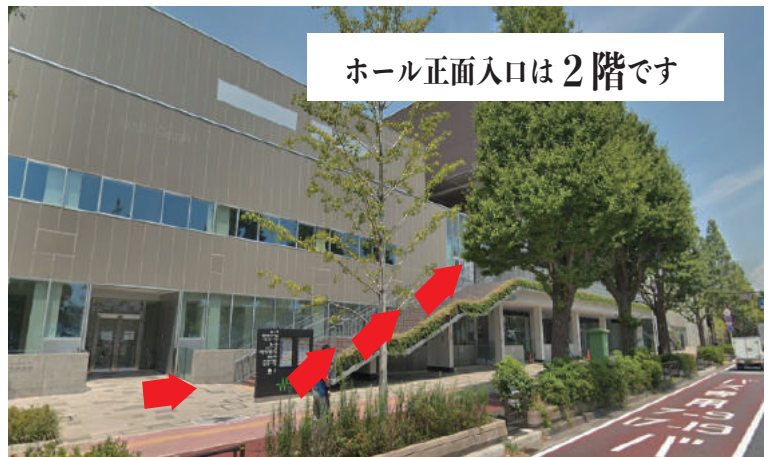
ホール正面入口は2階です