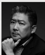
ロン・ユー (指揮) Conductor: Long Yu

ニューヨークタイムズ紙に「中国のクラシック界において最も影響力を持つ人物」と評されるロン・ユーは、国際的に名声を確立している卓越した中国人指揮者として、その活躍の場を広げている。現在、北京国際音楽祭の芸術委員会委員長、中国フィルハーモニー管弦楽団の芸術監督、上海交響楽団と広州交響楽団の音楽監督、さらに上海夏季音楽祭(MISA)の共同ディレクター、香港フィルハーモニー管弦楽団の首席客演指揮者。1998年の創設時から2018年まで芸術監督を務めた北京国際音楽祭は、彼の構想と尽力によって世界屈指の音楽祭にまで発展した。2018年6月に中国人指揮者として初めて、ドイツ・グラモフォンと専属契約を結んでいる。