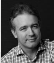
アレクセイ・ヴォロディン(ピアノ)

オフィシャルサイト http://www.michiyoshi-inoue.com/