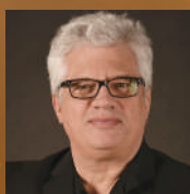
ヴェルナー・ギュラ