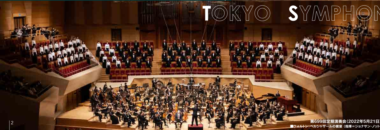
第699回定期演奏会(2022年5月21日)

1987年に東京交響楽団専属のアマチュア混声合唱団として創立。「東京交響楽団と一体の演奏をし、より質の高い合唱付きオーケストラ曲のコンサートを提供する」ことを目的としている。2020年ミュージック・ベンクラブ音楽賞「室内楽・合唱部門」を受賞。その実力は歴代の音楽監督にも信頼され、数多くの名演を残している。