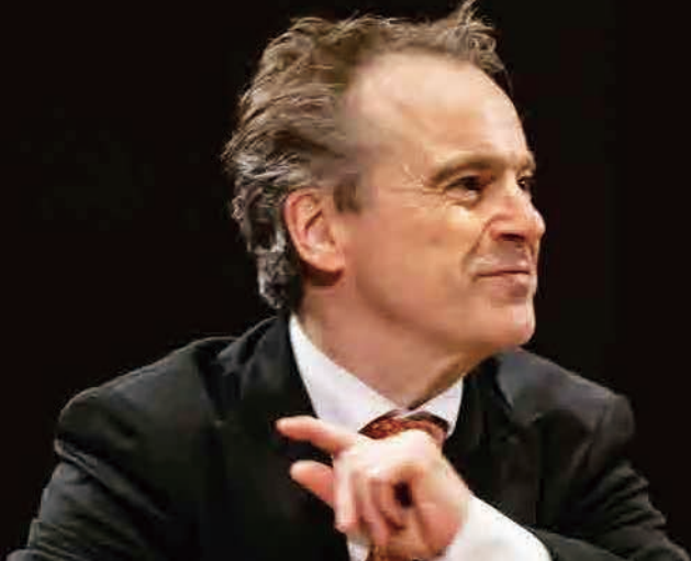
東京交響楽団 音楽監督 ジョナサン・ノット

東京交響楽団第3代音楽監督。ルツェルン響首席指揮者兼劇場音楽監督、EIC音楽監督、バンベルク響首席指揮者を経て、2017年よりスイス・ロマン管音楽監督も務める。抜群のプログラミングセンスと幅広いレパートリーで、世界の主要オーケストラ・音楽祭に客演。東響とともに2020年「ミュージック・ベンクラブ音楽賞(オペラ・オーケストラ部門)」、2022年音楽の友誌「コンサート・ベストテン」国内オーケストラ最高位、毎日新聞クラシックナビ「音楽評論家・記者が選ぶコンサート・ベストテン」第1位に選出。オクタヴィアレコードより多くのCDをリリースしている。