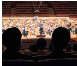
ゲネプロ見学会の様子

税制上の優遇措置について 内閣府より公益財団法人の認定を受けている当楽団へのご寄附には、税制上の優遇措置が施されます(各該法令で定められた限度額があります)。 ■個人の場合:「寄付金額から2,000円除いた金額」の40%分、所得税が控除されます。また、個人住民税や相続税も控除の対象になります。 ■法人の場合:「損金算入限度額」が一定の算式に従い、拡大されます。